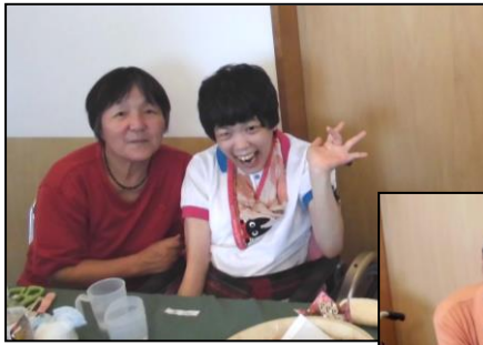
↑元気いっばいの女性利用者さんとその保護者さん。