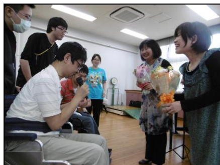
←仲間の会(利用者の会)を代表して、お礼の花束とあいさつをしました。