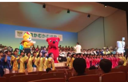
↑柏市立柏高校プラスバンド。言わずと知れた演奏で、魅了されてしまいました。