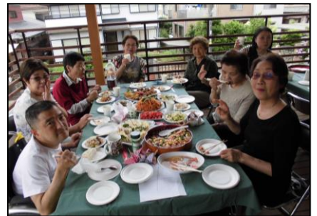
→男性利用者さんとその保護者さん。そしてボランティアさん。賑やかです。