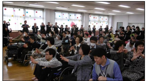
↑毎年恒例の歓迎の手話ダンス「あなたが好きだから」

柏市歯科医師会様より「かむかむコンサート」へのご招待をいただき、利用者の皆さん、ボランティアさんと参加してまいりました。また同時にいずみ園の展示もさせていただきました。