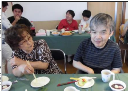
→男性利用者さんとその保護者さん。保護者さんも、これまで頑張ってきたので。