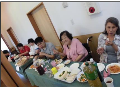
↑女性利用者さんにとって、初めての周年食事です。もう少しで1年ですね。