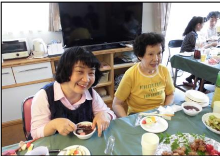
↑女性利用者さんとその保護者さん。最後のデザートですね。