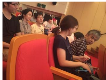
←8名の利用者が参加させていただきました。