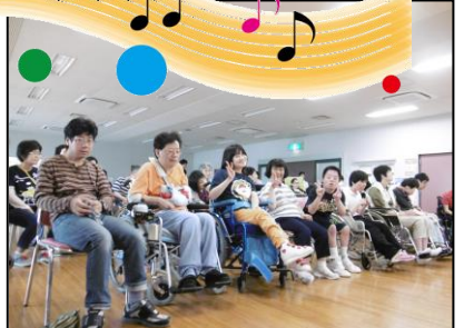
→楽しいそんな雰囲気出てますね！